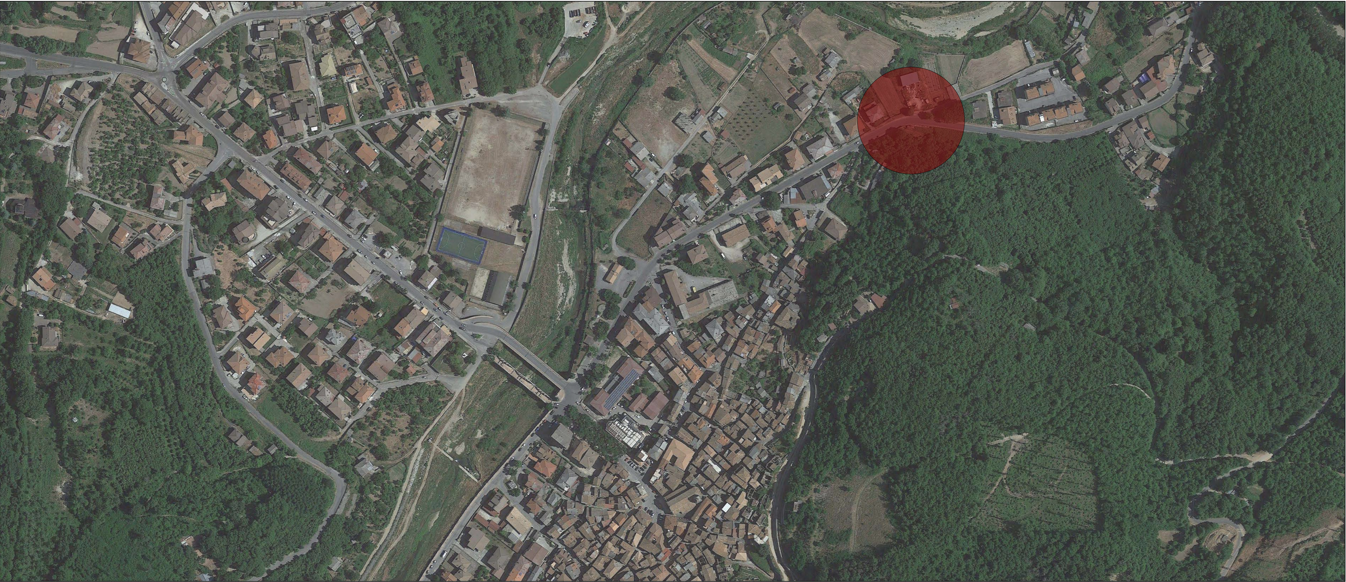
LOCALIZZAZIONE INTERVENTO COORD: 38°38'45.82"N 16°23'25.63"E