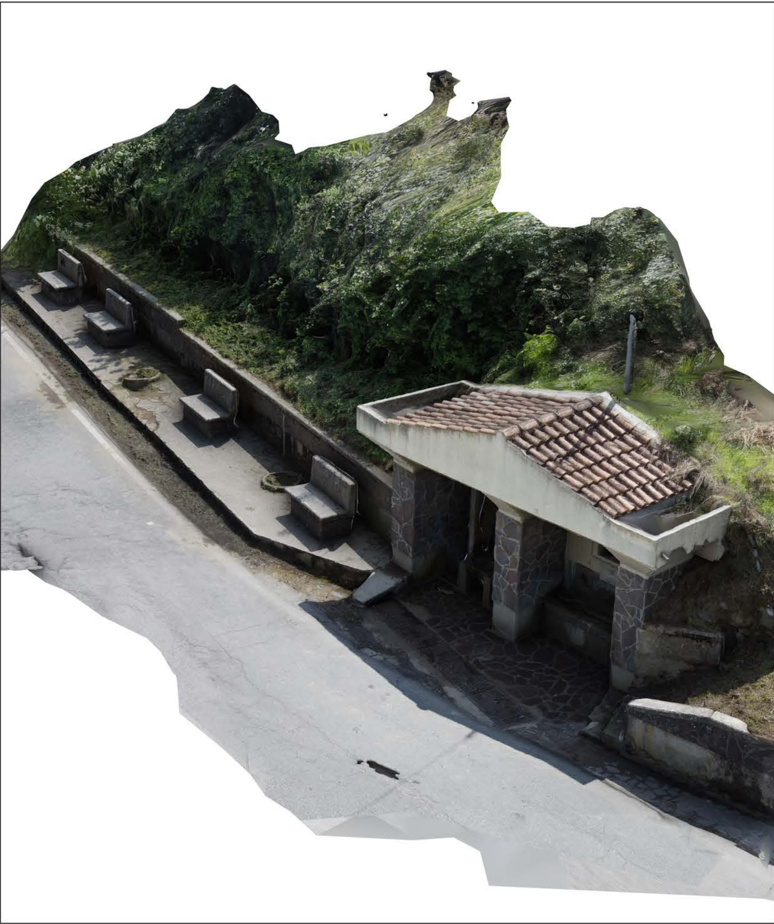
RICOSTRUZIONE FOTOGRAMMETRICA - STATO DI FATTO